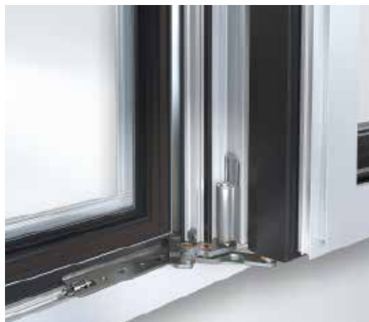
Угловая опора с углом открывания 180° Corner pivot with 180° opening angle