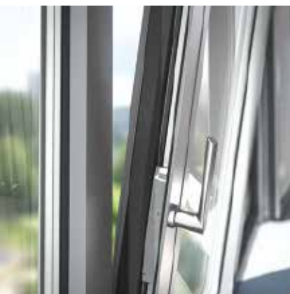
„Гибридная“ ригельштанга в проверенном алюминиевом дизайне Hybrid locking bar in tried-and-tested aluminium design