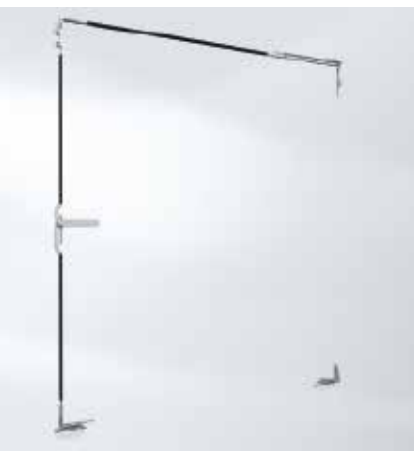
Конфигурация фурнитуры поворотно-откидного окна Fittings configuration for turn/tilt windows