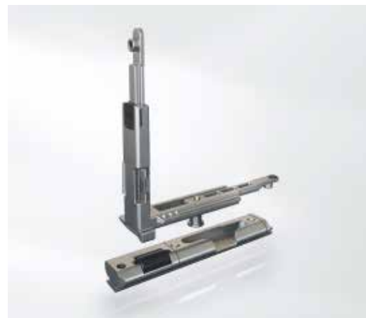
Передачный уголок со встроенным стопорным роликом и опорной пятой Corner drive with integrated locking roller and with engagement block